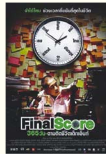
4. Final Score 365 วัน ตามติดชีวิตเด็กเอ็นท์