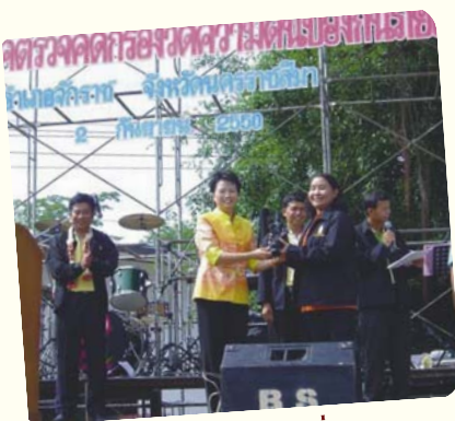
ศูนย์สุขภาพจิตที่ 5