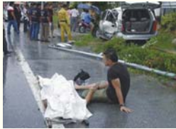
1. ภาพคาถอน