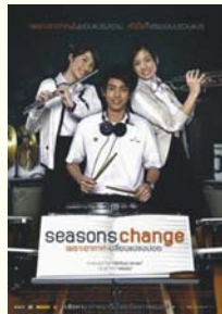
2. Season Change เพราะอากาศเปลี่ยนแปลงบ่อย