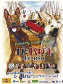
3. มะหมา 4 ขาครึ่ง