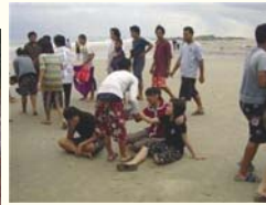
4. ภาพสังเวชนีย์รำพึง