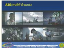
2. คนดีหัวใจแกร่ง