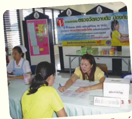
โรงพยาบาลจิตเวชเลยราชนครินทร์