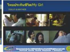
4. My Girl