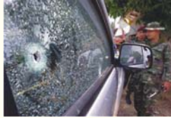
3. ภาพยิงครู