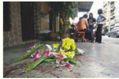
2. ภาพอาลัย