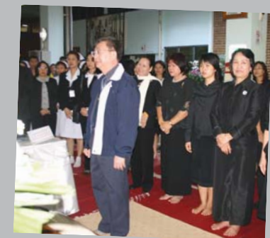
ถวายราชสดุดีและ ร่วมลงนามถวายความไว้อาลัย ณ โรงพยาบาลสวนปรุง จังหวัดเชียงใหม่