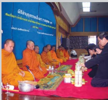
จัดพิธีทำบุญถวายเป็นพระราชกุศล ณ โรงพยาบาลจิตเวชขอนแก่นราชนครินทร์ จังหวัดขอนแก่น