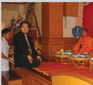
ร่วมลงนามเพื่อไว้อาลัยแด่สมเด็จพระเจ้าพี่นางเธอฯ ณ สถาบันกัลยาณ์ราชนครินทร์ กรุงเทพมหานคร