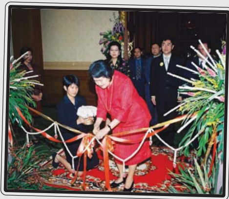
ภาพงานประชุมวิชาการสุขภาพจิตนานาชาติ ครั้งที่ 1

-เสด็จเป็นองค์ประธานการประชุมวิชาการกรมสุขภาพจิตนานาชาติ ตั้งแต่ครั้งที่ 1 ในปี 2545 เป็นต้นมา ทั้งนี้ ได้ประทานรางวัล Mental Health Princess Award แก่ชาวไทย ชาวต่างประเทศและหน่วยงาน ผู้ที่ได้ดำเนินงานด้านสุขภาพจิตจนเกิดประโยชน์สูงสุดต่อสังคมโดยรวม ตั้งแต่ปี 2546 เป็นต้นมา จนถึงปัจจุบัน และในการประชุมวิชาการนานาชาติครั้งที่ 2 องค์การอนามัยโลกประจำภาคพื้นเอเชียตะวันออกเฉียงใต้ (WHO/SEARO) ได้ถวายรางวัล WHO/SEARO Award แต่สมเด็จพระเจ้าพี่นางเธอเจ้าฟ้ากัลยาณิวัฒนา กรมหลวงนราธิวาสราชนครินทร์ ด้วย