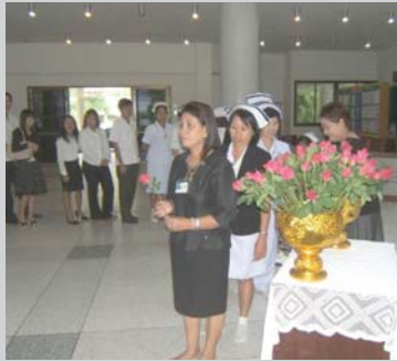
ร่วมลงนามสักการะสมเด็จพระเจ้าพี่นางเธอฯ ณ โรงพยาบาลสวนสราญรมย์ จังหวัดสุราษฎร์ธานี