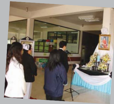
ร่วมลงนามถวายความอาลัย ณ โรงพยาบาลจิตเวชเลยราชนครินทร์ จังหวัดเลย