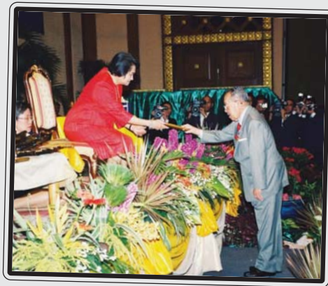
ภาพงานประชุมวิชาการสุขภาพจิตนานาชาติ ครั้งที่ 2