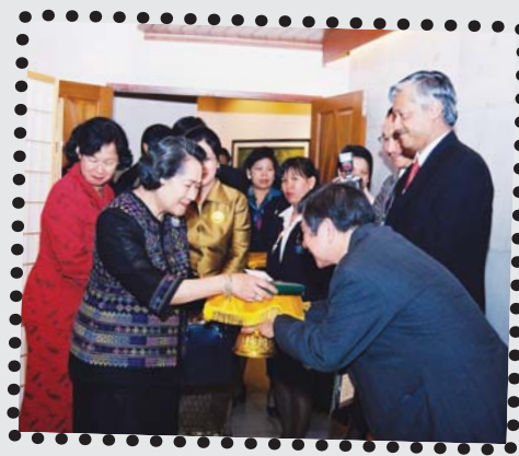
ภาพงานประชุมวิชาการสุขภาพจิตนานาชาติ ครั้งที่ 3